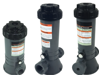
500060C 500060M 500065M